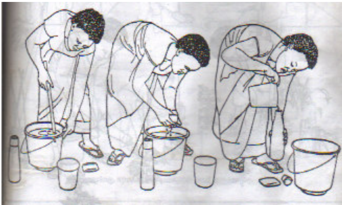
Kutayarisha dawa ya kiasili.

Harufu ya vitunguu hukanganya wadudu ili wasiweze kutambua mmea wanaoshambulia.