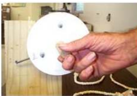
Sehemu ya mbele ya kuzungusha