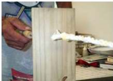
Sehemu ya nyuma na kishikilio