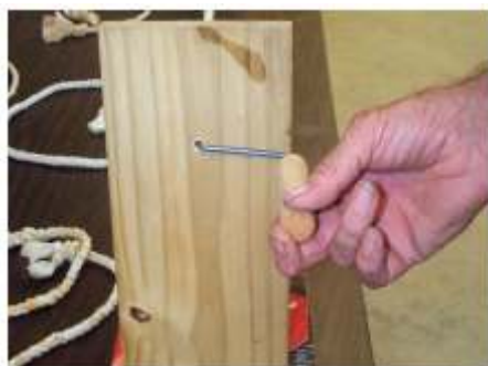
Sehemu ya nyuma ya kuzungusha

Kifaa hiki chapaswa kutumiwa na watu wawili ili kutengeneza kamba, mtu mmoja akishughulikia zile ekseli na mwingine kusongesha kifaa cha kuelekeza kamba wakati wa kufuma